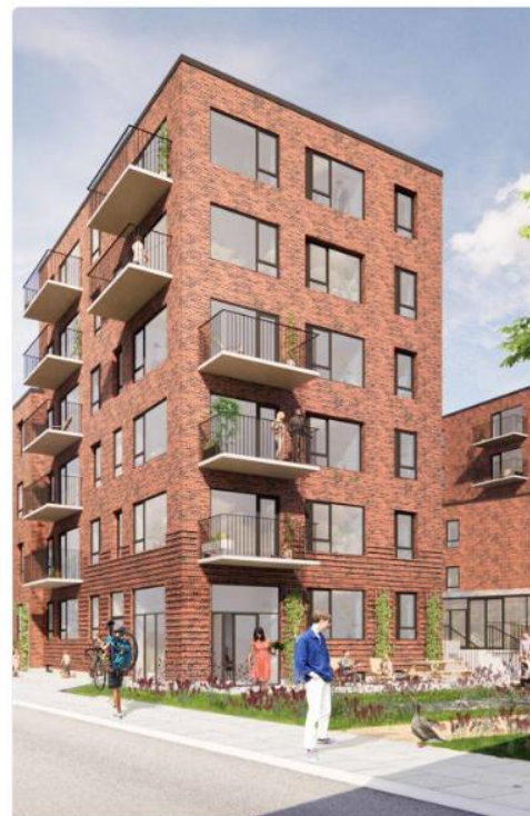
Kommende boliger - Bonum Development →

Eksklusive ejerlejligheder på 2-5 værelser.