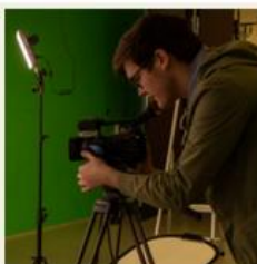
Medier og kommunikasjon