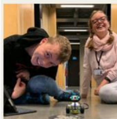
Arbeids- og hverdagslivstrening