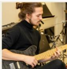
Musikk og dans