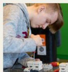
Elektro og datateknologi