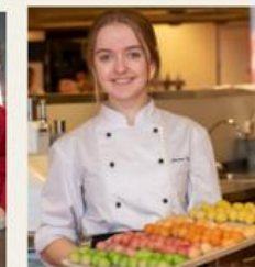
Restaurant- og matfag