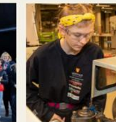
Teknologi- og industrifag