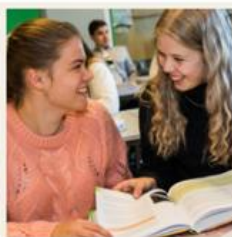
Påbygging til generell studiekompetanse