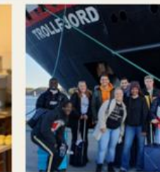
Salg, sevice og reiseliv