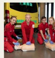
Helse- og oppvekstfag