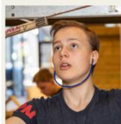
Bygg- og anleggsteknikk